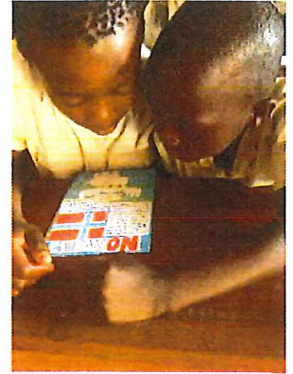
Elevene i Kongo leser om Norge skrevet av elever på Rykene skole

For pengene vi har samlet inn ved forrige flaskeinnsamling og rundstykkessalg har vi kjøpt en vanntank på 300 liter, såpe og pulver. Vennskapsskolen vår er i stadig vekst og har nå behov for flere klasserom.