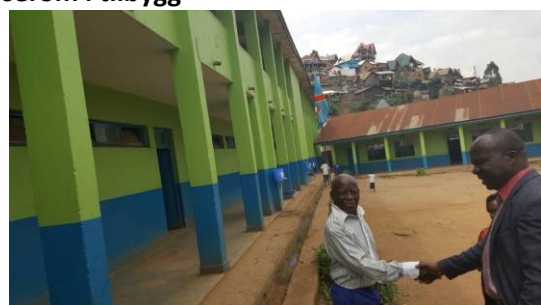
EP Nyamugu fremstår nesten som ny

Barneskolen Nyamugu fikk overført USD 10540/ NOK 93784 i 2020 til fullføring av rehabiliteringsarbeidet som ble påbegynt året før. Resterende pulter ble kjøpt inn, det ble bygget et klasserom i tilbygg og skolen fikk et