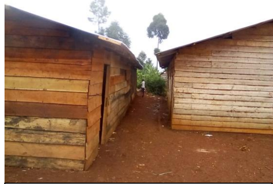
Døren mangler fortsatt, men resten av det nye klasserommet er ferdig.

I 2020 ble det overført USD 3350 / NOK 29794 til bygging av et nytt klasserom i tre og til pulter i dette klasserommet. Arbeidet er ferdig utført.