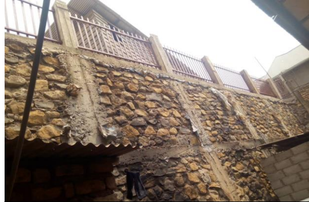
Deler av nedre støttemur på EP Mukukwe

Mukukwe skole ligger i sterkt skånende terreng hvor jordsmonnet som stort sett består av leire. Vinteren 2019/2020 begynte grunnen under seks provisoriske klasserom i trebrakker å rase ut som følge av ekstrem nedbør. Det ble derfor opprettet et ad hock-prosjekt for å få bygge en solid støttemur langs nedre del av tomten. I tillegg til støttemur langs nedre grense av tomten, ble det bygget en mindre avgrensende og beskyttende mur langs øvre grense.