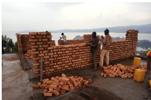
Blokk 1, andre etasje under oppføring

Institute Makedonia har holdt til i elendige trebrakker i en årrekke. I løpet av 2020 ble det utarbeidet prosjektplan og budsjett for en ny skolebygning i tre etasjer med 18 klasserom, to kontorer og et samlingsrom. Det ferdige bygget vil bestå av fire blokker rundt en kvadratisk skoleplass og bygging av første blokk er i full gang.