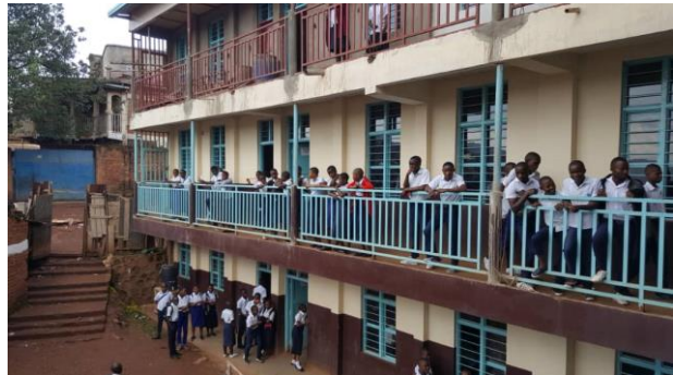
Den ene delen av den L-formete bygningen.

I 2020 ble det overført USD 53.500 / NOK 389.829