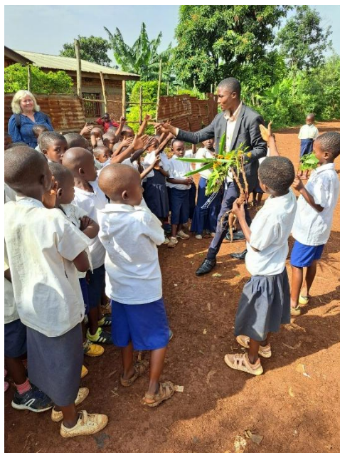
Uteskole på EP Kabonde

Kalenderåret 2024 var i stor grad preget av prosjektreise til Bukavu i februar/mars. Reisegruppen besto av totalt ni personer, tre fra styret og to lærere fra hver av de tre Urafiki-skolene Lynghaug, Rykene og Seim. En fylldig rapport er tilgjengelig på www.urfiki.no 6 . Erfaringer og evaluering av utbytte av reisen omtales derfor bare i liten grad i årsberetningen.