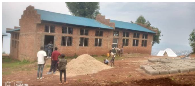
EP Mulambula ian 2023

Byggeprosjektet omfatter ni klasserom, kontorer og toaletter. Arbeidet startet så smått i 2017 med øremerkete midler fra elev-aksjoner på Midtun skole, fra og med 2021 også med tilsvarende øremerkete gaver fra Seim skole. Fra og med 2023 er byggeprosjektet på Mulambula Urafikis hovedprosjekt.