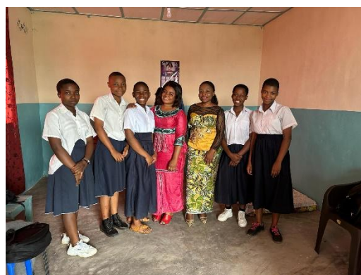
Fra jenterommet på Kazaroho

I 2023 ble det opprettet direkte kontakt mellom de kvinnelige lærerne som er involvert i tiltaket ved Institute Tumaini og en prosjektgruppe innenfor Urafiki. Kontakten ble etablert som et forprosjekt for å bli kjent med jenters/kvinnens spesielle utfordringer, diskutere eksisterende tiltak og avklare ønsker og behov, samt å legge grunnlag for et eventuelt jenteprojekt som kunne inkludere alle de fire instituttene.