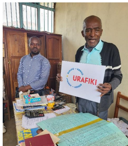
Rektor Lunshombo på Institute Makedonia takker «tysklandsgruppen» og de to styrene for innsats og arbeid.

Arbeidet på Institute Makedonia har gått raskt fremover og høsten 2023 var alle de 12 klasserommene ferdig pusset og malt og klar til bruk og skolen hadde fått en solid og fin inngangsport. Tre klasserom var innredet med nye pulter. Overført beløp i 2023: $ 10700. Et av de tolv rommene brukes foreløpig til kombinert kontor og lærerrom. Den fine nye skolen vekker oppmerksomhet i omgivelsene og flere elever søker seg til skolen.