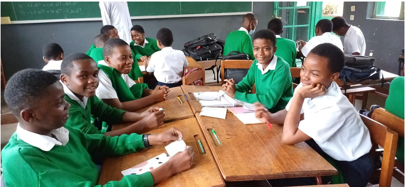
Gruppearbeid i matematikk på Institute Tumaini.