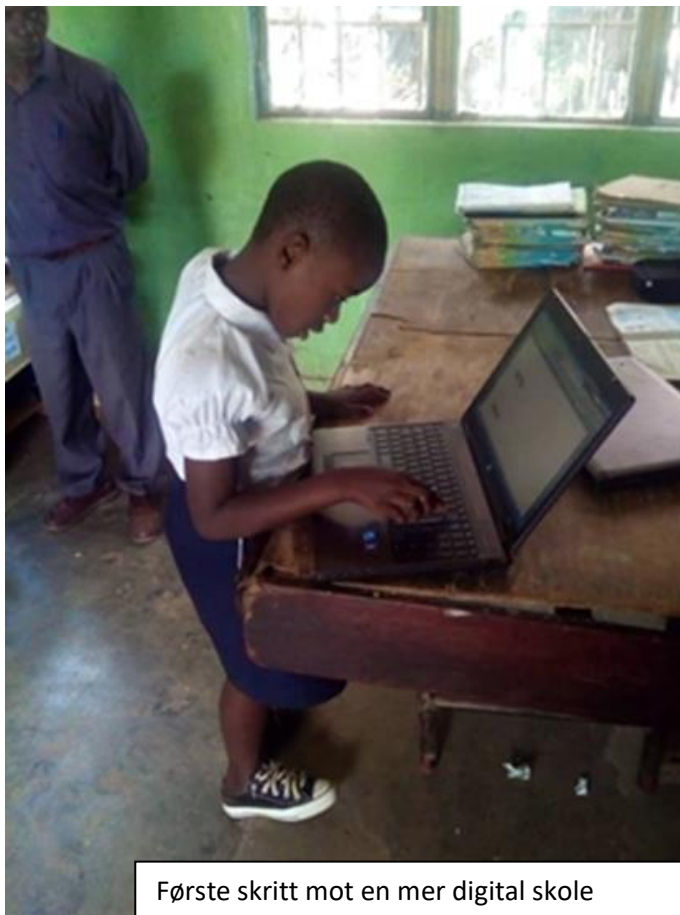
Første skritt mot en mer digital skole

EP Nyamugo har også tatt det første skrittet inn i fremtidens klasserom med digitale hjelpemidler drevet av solceller. Foreløpig disponerer skolen bare de fem lapstop-ene som de har fått fra Norge, men flere er på vei. Dermed er rammene lagt for god undervisning og for en kontinuerlig utvikling av undervisningskvaliteten i samarbeid med de øvrige Urafiki-skolene i Bukavu og med vennskapsskoler i Norge.