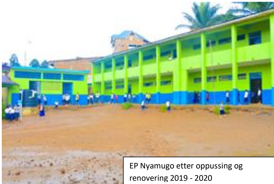
EP Nyamugo etter oppussing og renovering 2019 - 2020

Prosjektperiode: August 2019 – mars 2020