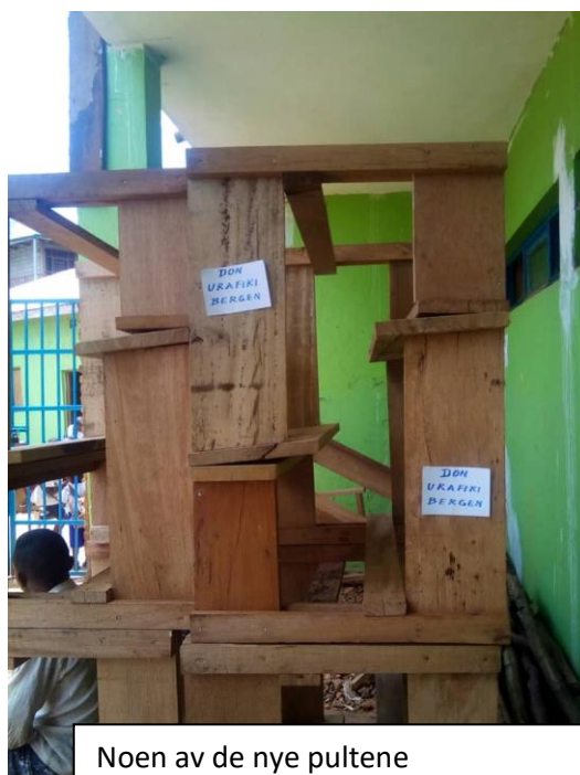
Noen av de nye pultene