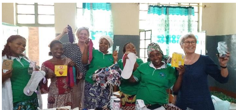
Fra møtet på jenterommet på Institut Tumaini

Jenters utfordring i forhold til skolegang har vært et tema i Urafiki de siste 1-2 årene, i første omgang i form av et forprosjekt knyttet til Institute Tumaini. Tumaini hadde allerede grepet fatt i problemstillingen ved å etablere et eget jenterom hvor jentene kan trekke seg tilbake ved behov i forbindelse med menstruasjonen. I forprosjektet er det etablert nettkontakt mellom skolens kvinnelige lærere og en «jentegruppe» innenfor Urafiki N hvor flere viktige tema har blitt diskutert. Det har bl.a. kommet frem at mange jenter mangler tjenlige sanitetsbind. Ulike varianter fleregangsbind var derfor med i koffertene fra Norge. Lycée Kazaroho har latt seg inspirere av tiltaket på Tumaini og har nå etablert sitt eget godt utstyrte jenterom. På begge skolene fikk vi møte representanter for jentene på skolen som fortalte om sine utfordringer og betydningen av skolens tilrettelegging. Barneskolen Nyamugo 2 har også et eget opplegg med fokus på jenter i tidlig pubertet som det blir interessant å følge.